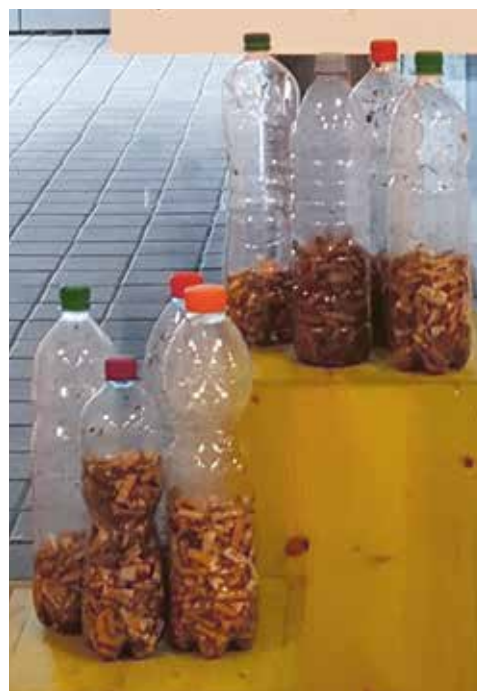
Fill the bottle