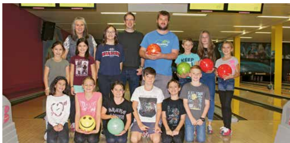
Mini-Ausflug ins Bowlingcenter Buchs