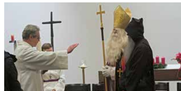
Der Nikolaus zu Gast in der Antoniuskirche