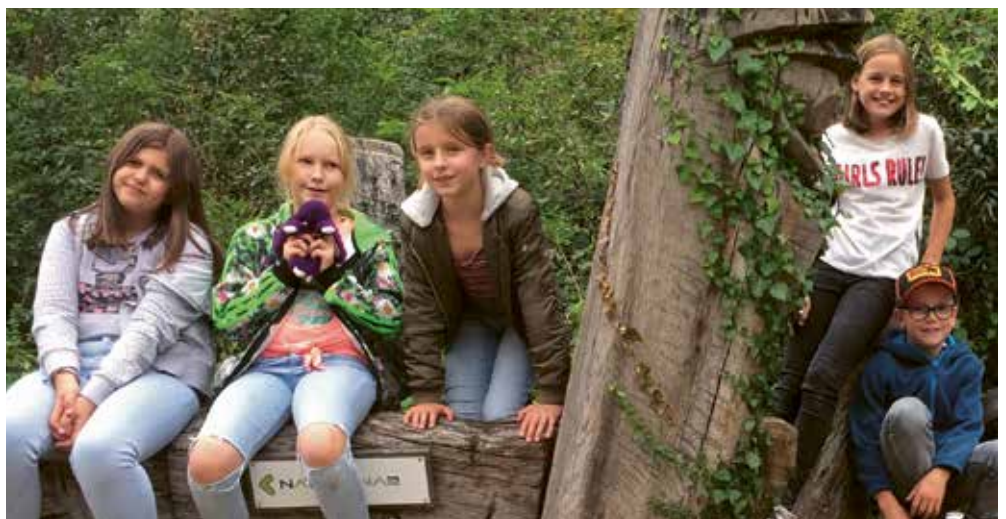
Minis bei der Schnitzeljagd

Beobachtungsstelle für Asyl- und Ausländerrecht St. Gallen Fr. 119.85