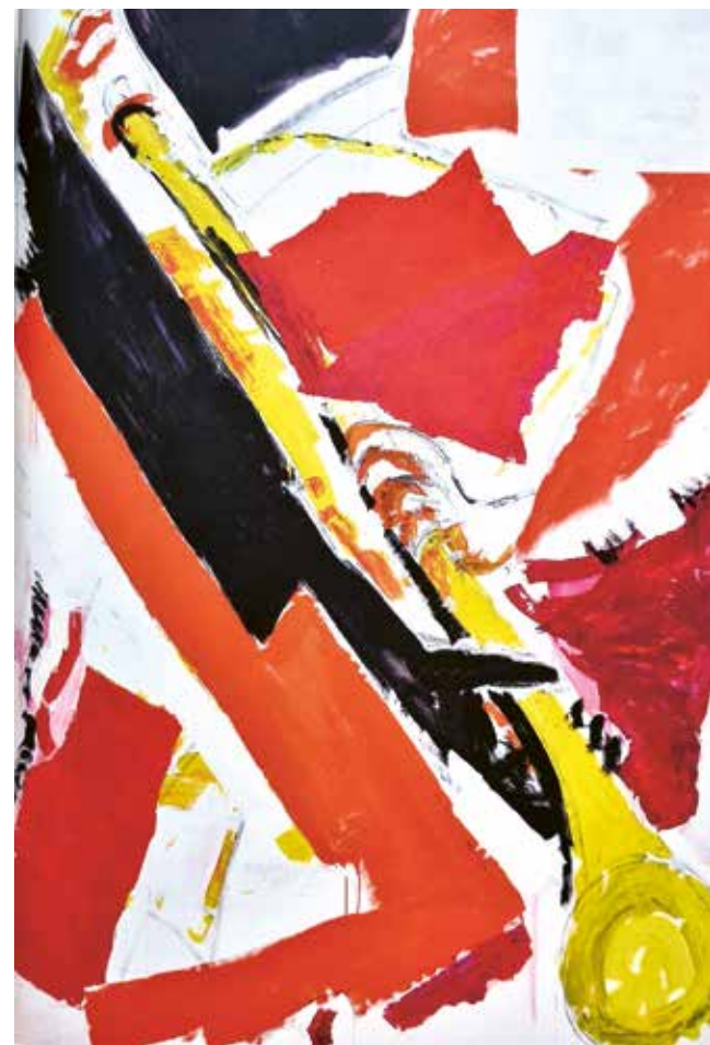
Kürzlich: Ein Engel mit Posaune

Wir gratulieren herzlich und wünschen der Familie Gottes Segen.