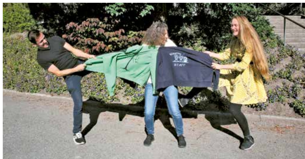
Manchmal kommt es schneller als geplant ...