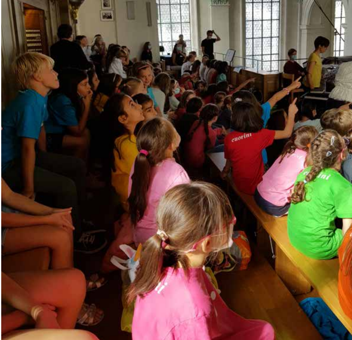
Cuorini beim 4. Bistums-Kinderchortreffen